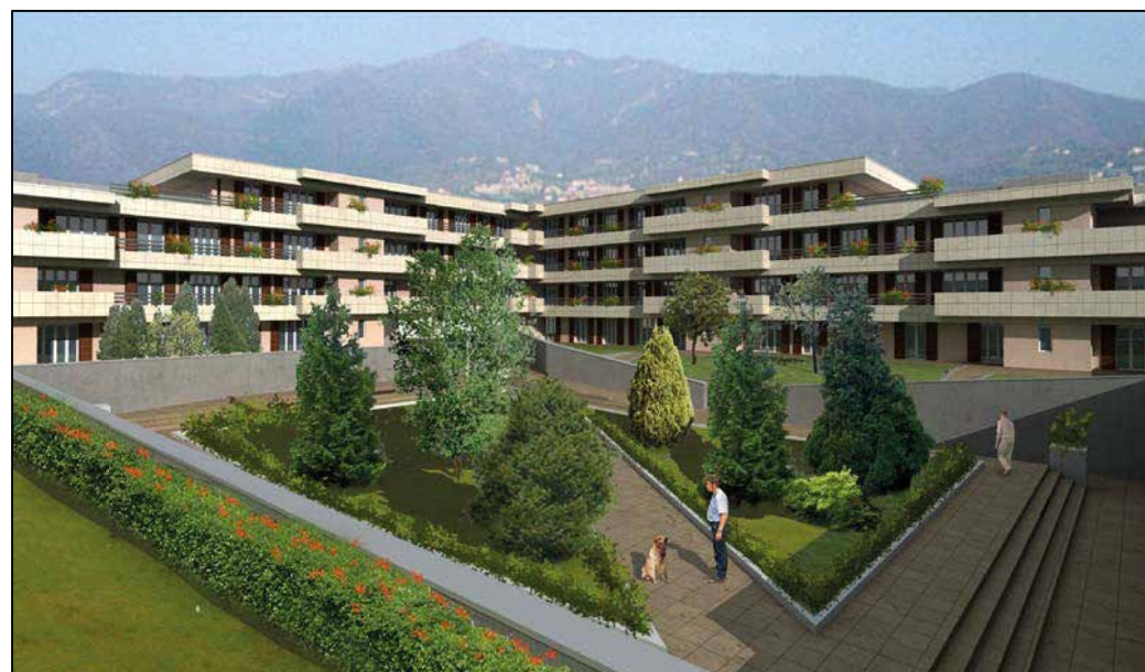
VISTA TRIDIMENSIONALE INTERNA