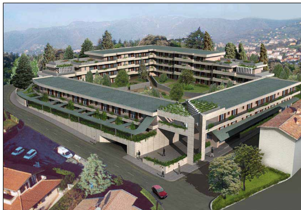
VISTA TRIDIMENSIONALE ESTERNA