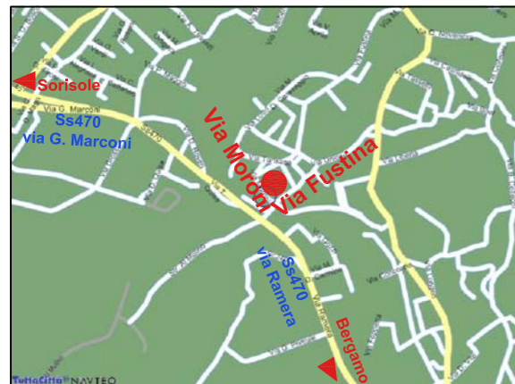
ESTRATTO DI MAPPA POSIZIONE INTERVENTO PONTERANICA (bg)