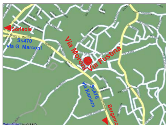
ESTRATTO DI MAPPA POSIZIONE INTERVENTO PONTERANICA (bg)