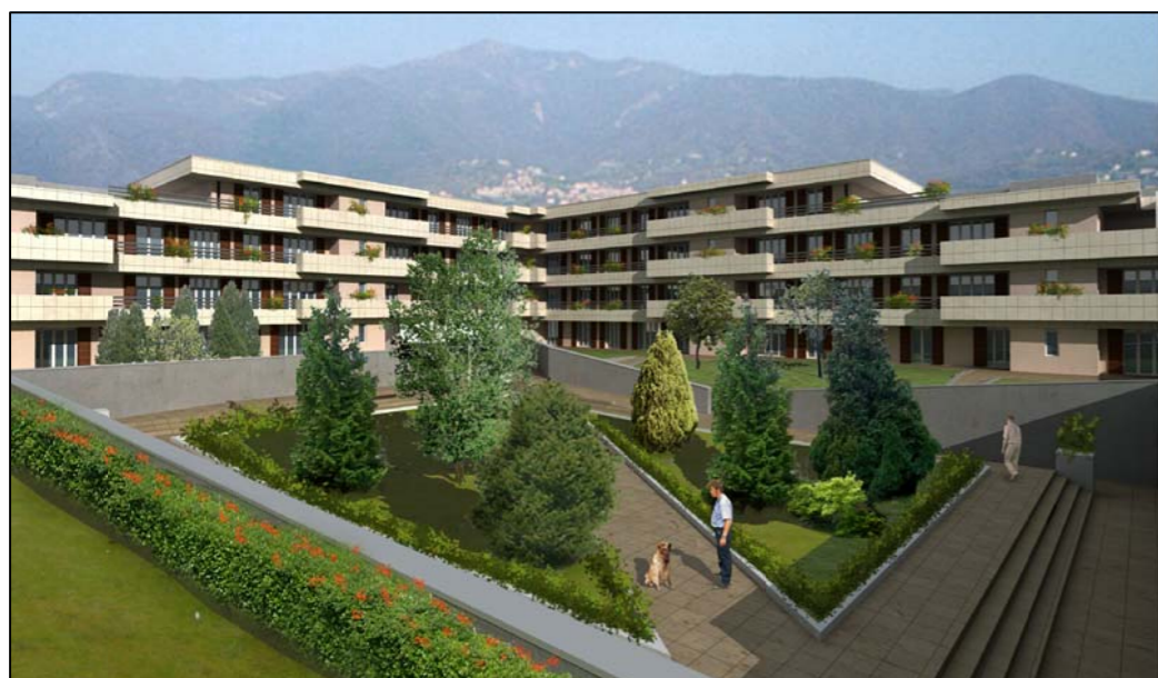
VISTA TRIDIMENSIONALE INTERNA