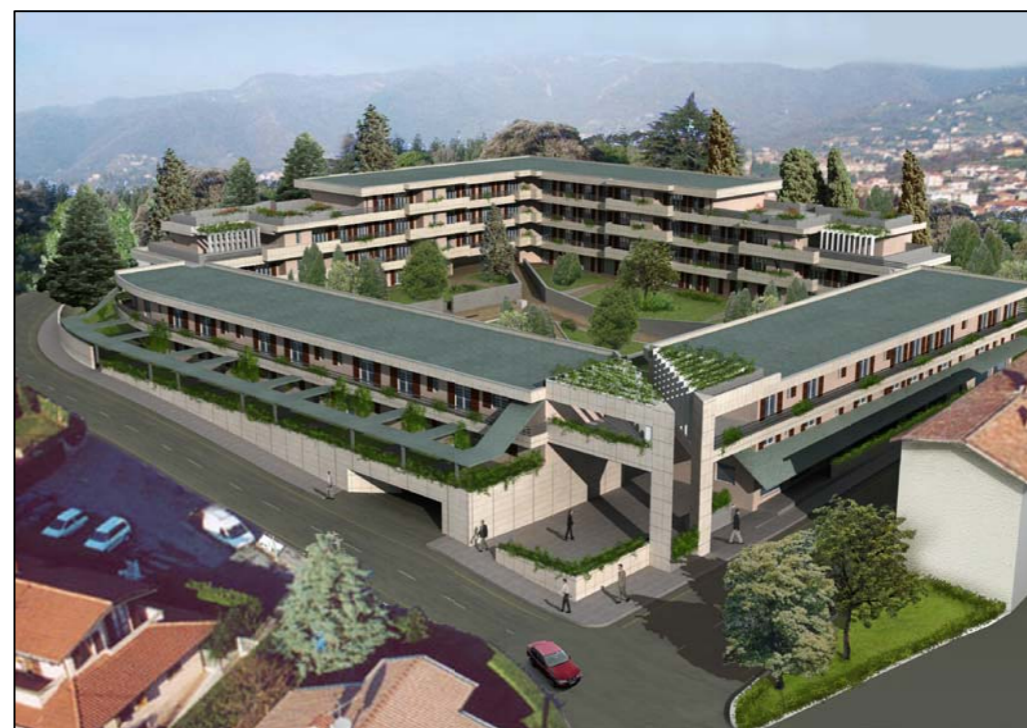
VISTA TRIDIMENSIONALE ESTERNA